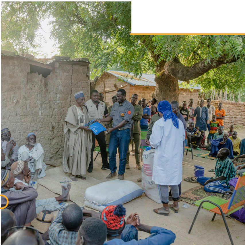
Les trois piliers du management : Les activités de gestion dans chaque aire protégée s'appuient sur trois piliers principaux